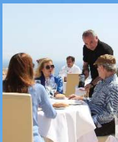
Restaurante La Cumbre