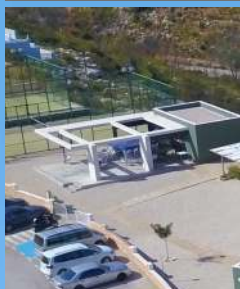
Bar Como en Casa