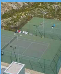
Pistas pádel y tenis