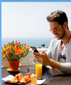
Restaurante Vista Ibiza