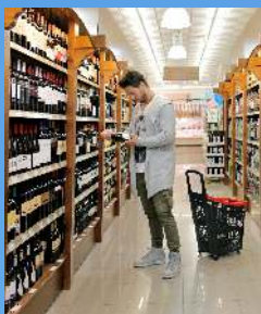
Supermercado Pepe la Sal