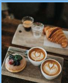
Kiosco del Sol